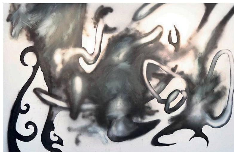
Werk van Robert Roest.